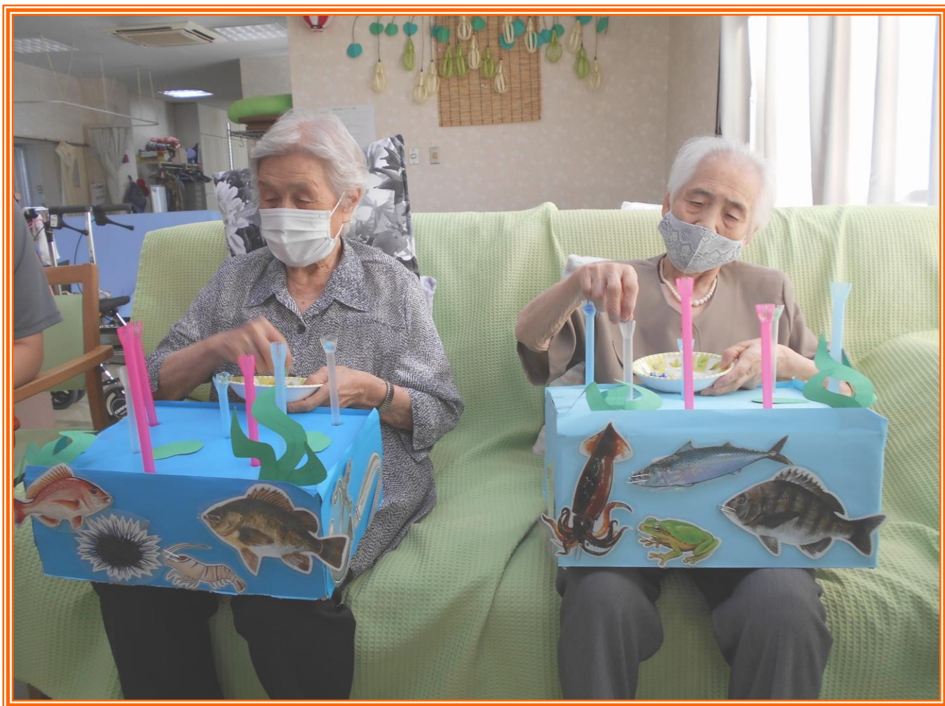
イツギンチャクゲーム