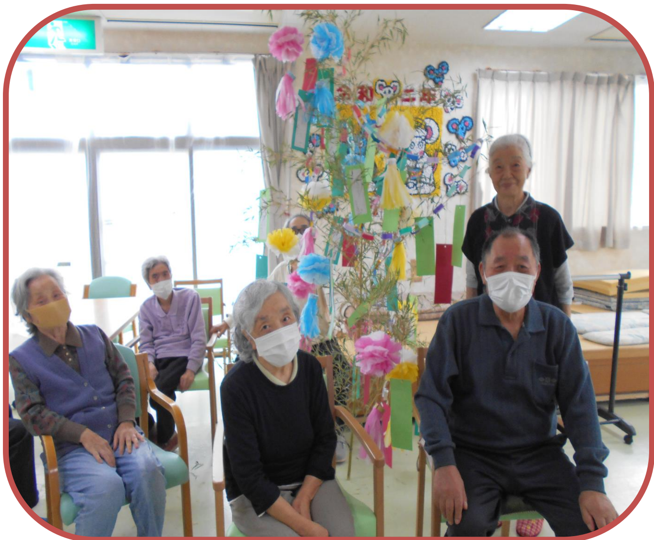
「七夕」飾りつけにて