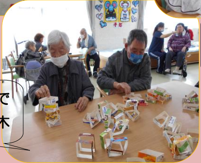
牛乳パックで 積み木