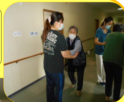
歩行リハビリ 皆さん、頑張っています！