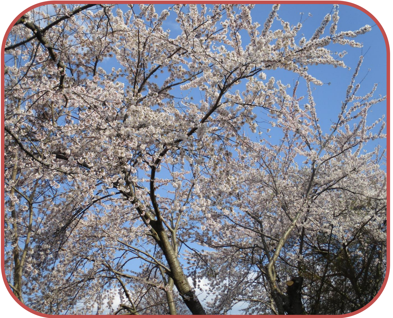
グリーンハイツの桜