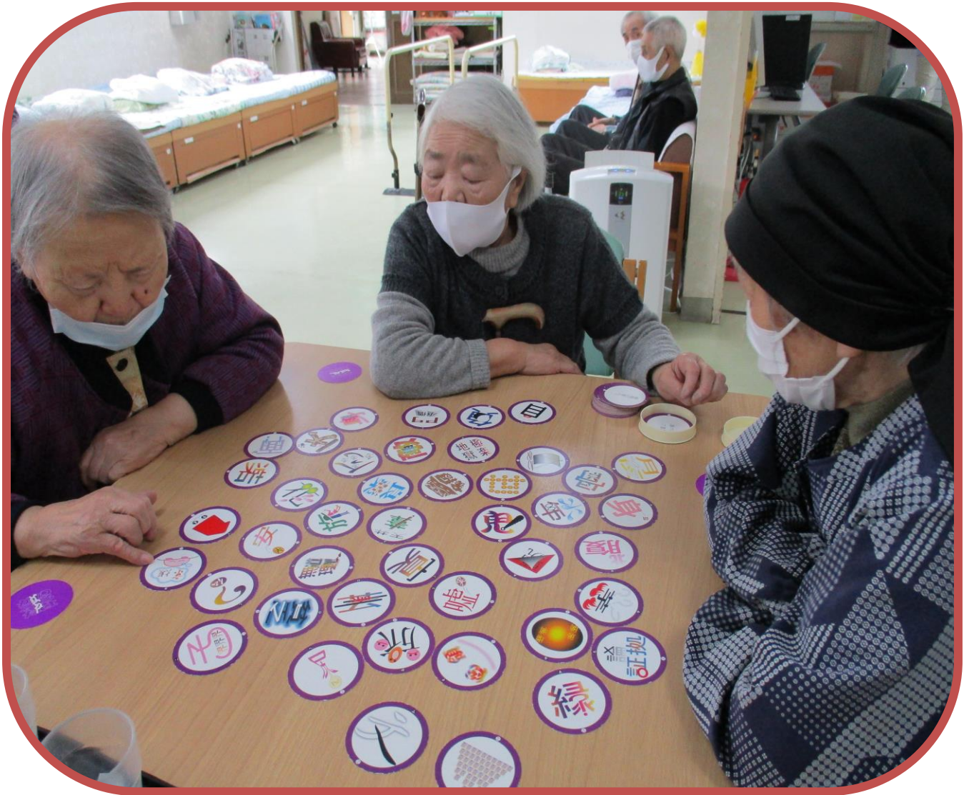
ことわざカルタにて