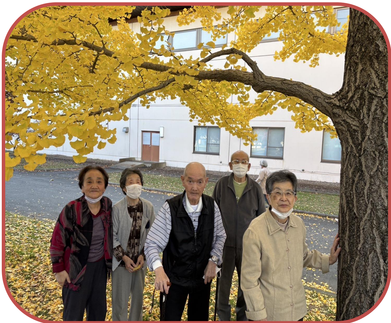
紅葉ドライブにて