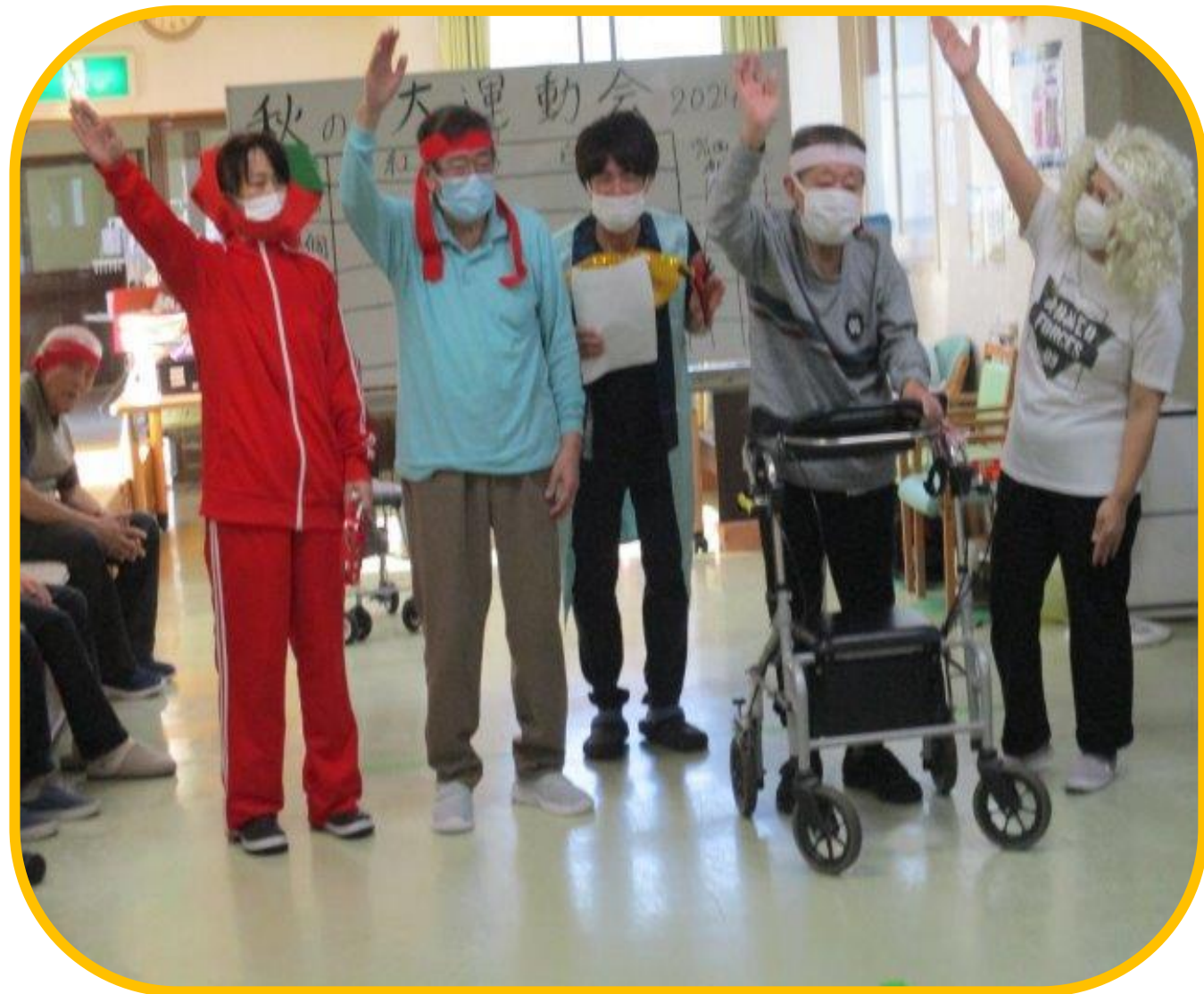
『秋の大運動会』選手宣誓！