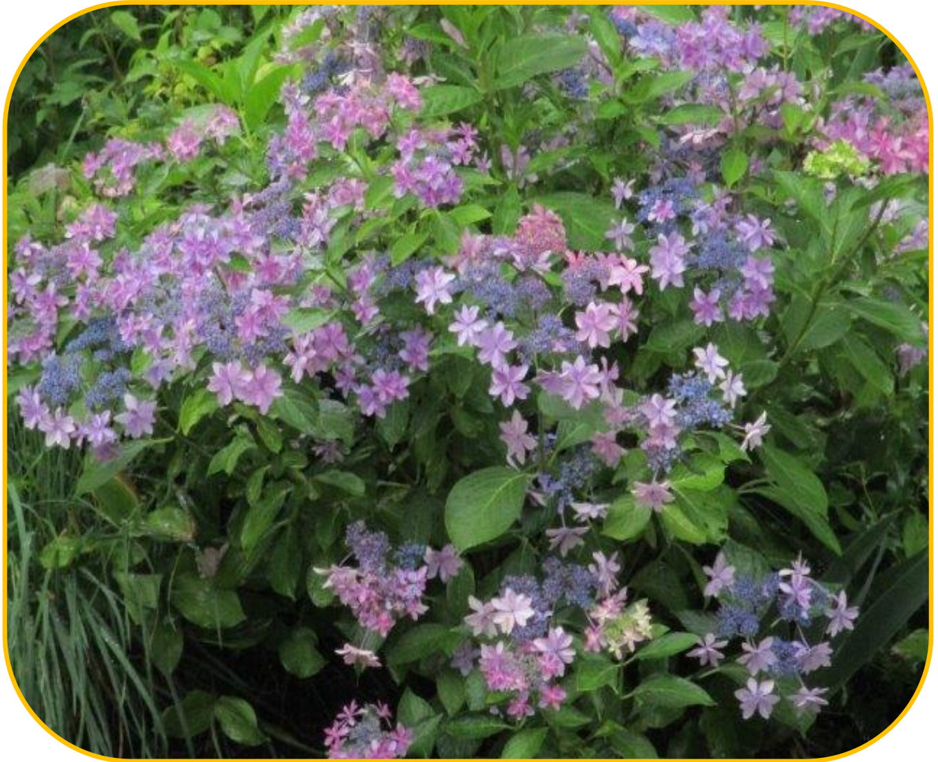
八戸グリーンハイツのガクアジサイ